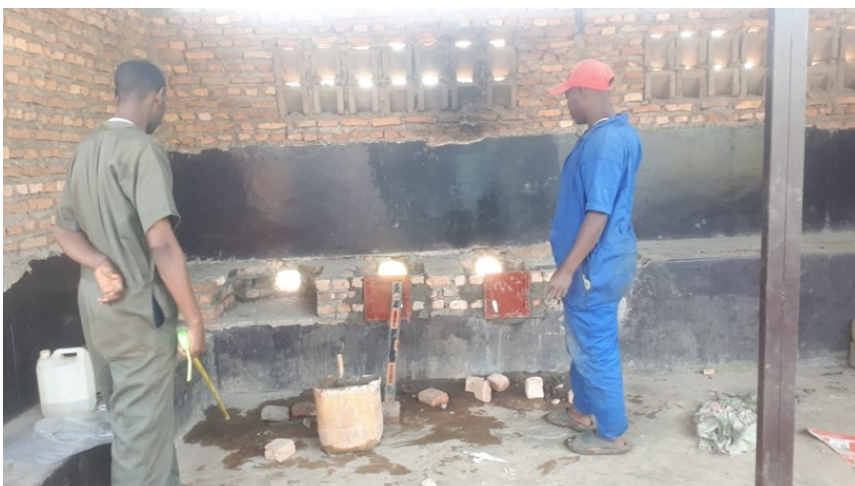
Restauración de la cocina