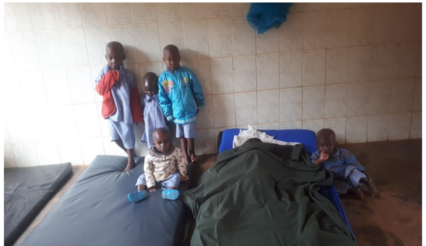
Recuperación de niños desnutridos, algunos de padres desconocidos, dejados a la puerta del Centro