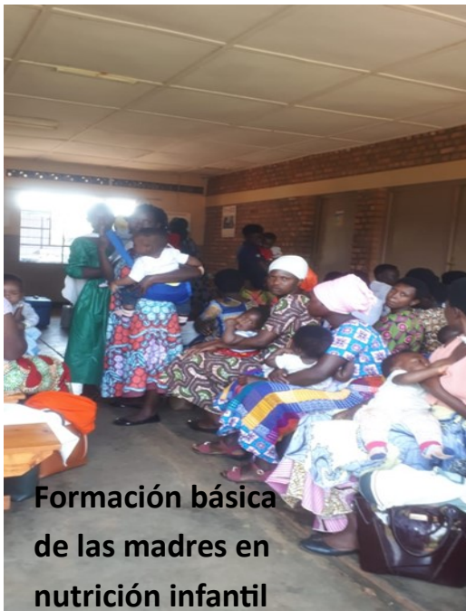
Formación básica de las madres en nutrición infantil