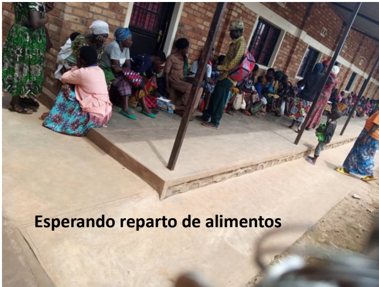
Esperando reparto de alimentos